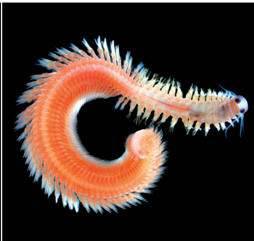
Zooplankton des Iles Gambier, groupe des Platyneis, espèce indéterminée.