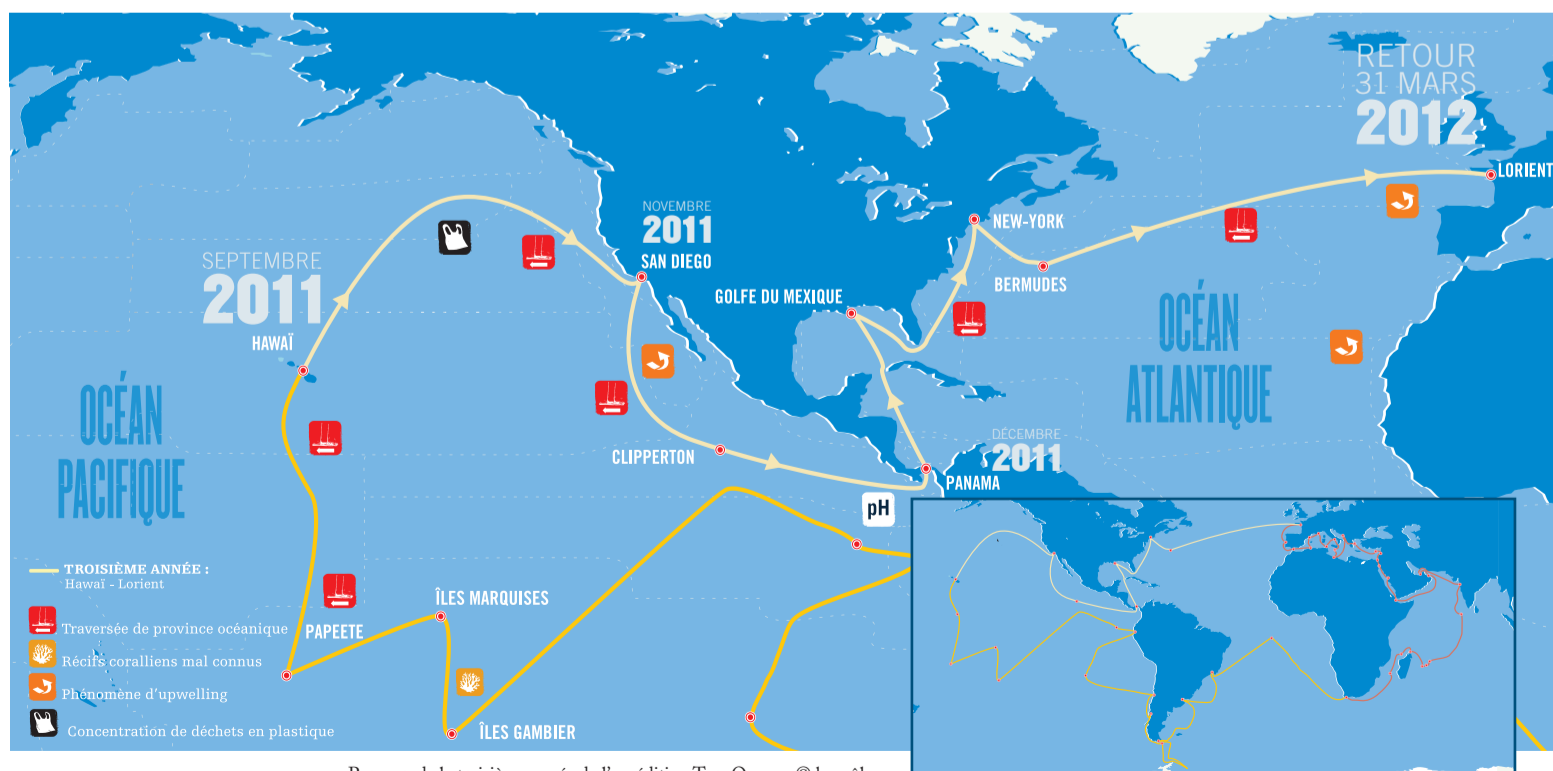
Parcours de la troisième année de l'expédition Tara Oceans.