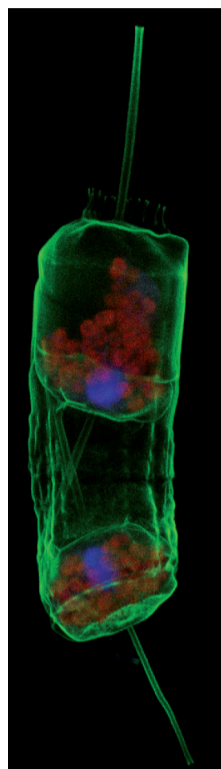
Protiste illuminé par fluorescence.