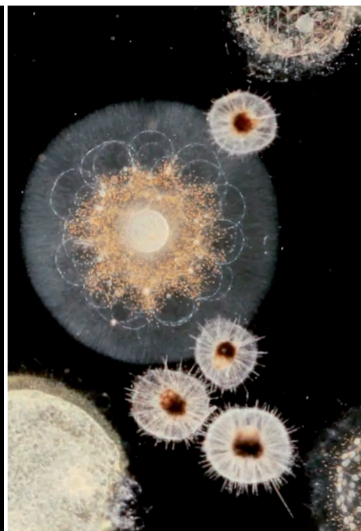
Protistes, composés d'une seule cellule semblable aux nôtres.

Un pour tous et tous pour un ! Cette célèbre devise pourrait être celle des chercheurs de Tara Oceans. Chacun selon sa spécialité s'affaire sur des données, sur des échantillons, mais tous portés par l'ambition commune de comprendre le fonctionnement des écosystèmes marins. En ce sens, l'expédition est déjà un succès : elle a permis de rassembler des experts d'horizons différents autour d'une même aventure scientifique.